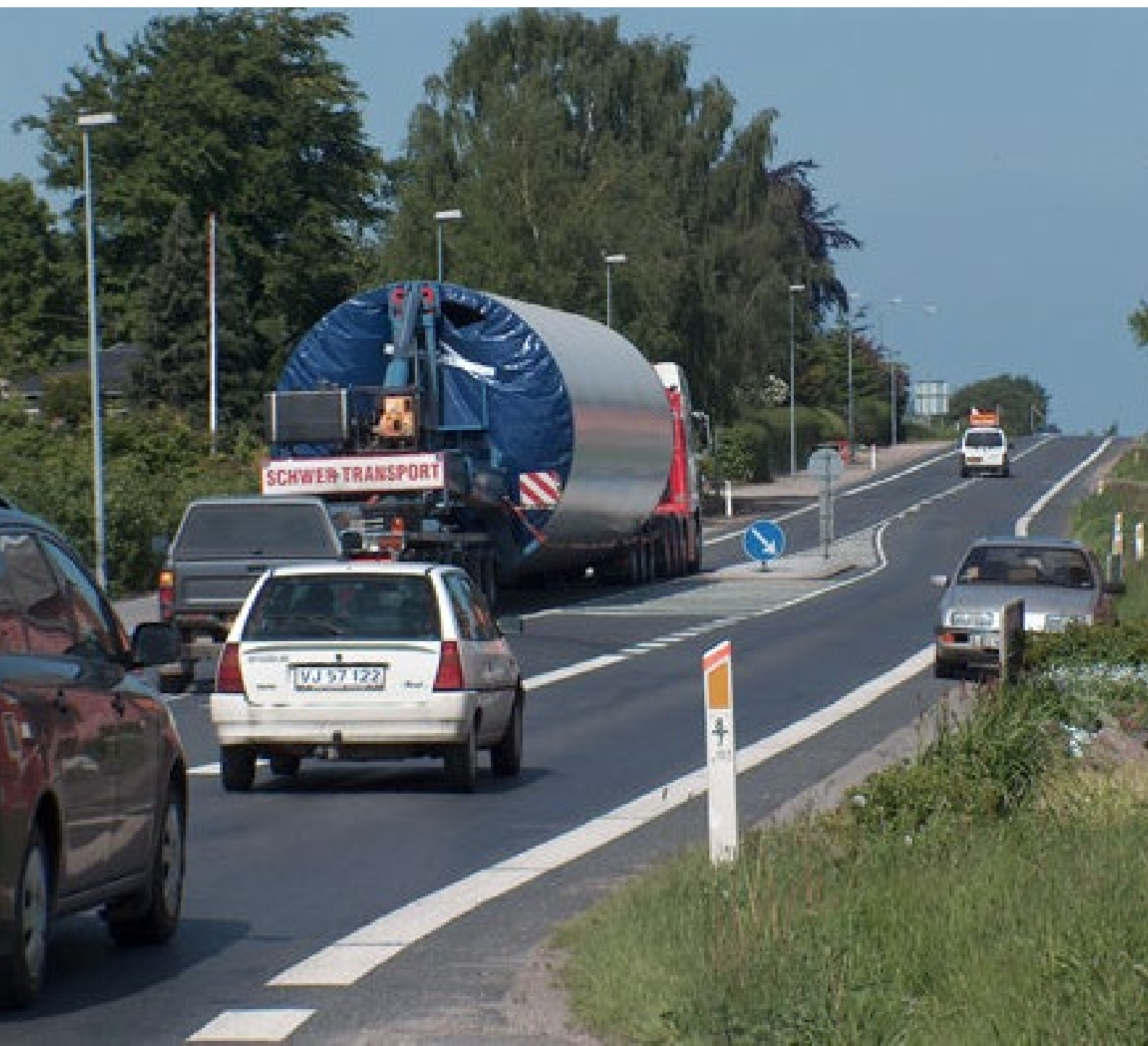
Figur 4: Sensorer kan bl.a. måle luftforureningen i bestemte områder i kommunen.