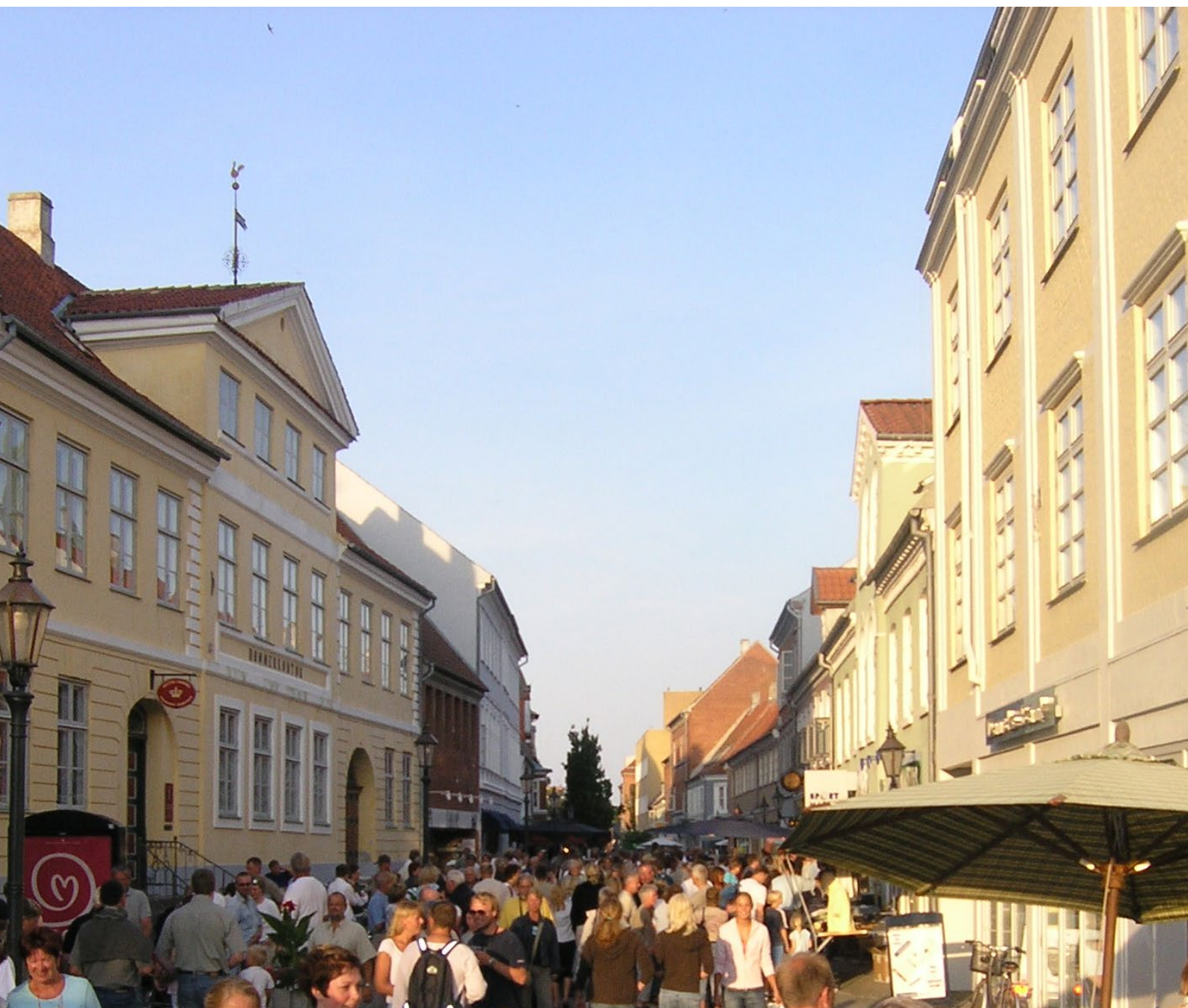
Figur 3: Open by Night i Nyborg. Mange digitale løsninger kan bidrage positivt til handelslivet i bymidten, f.eks. City Wifi.