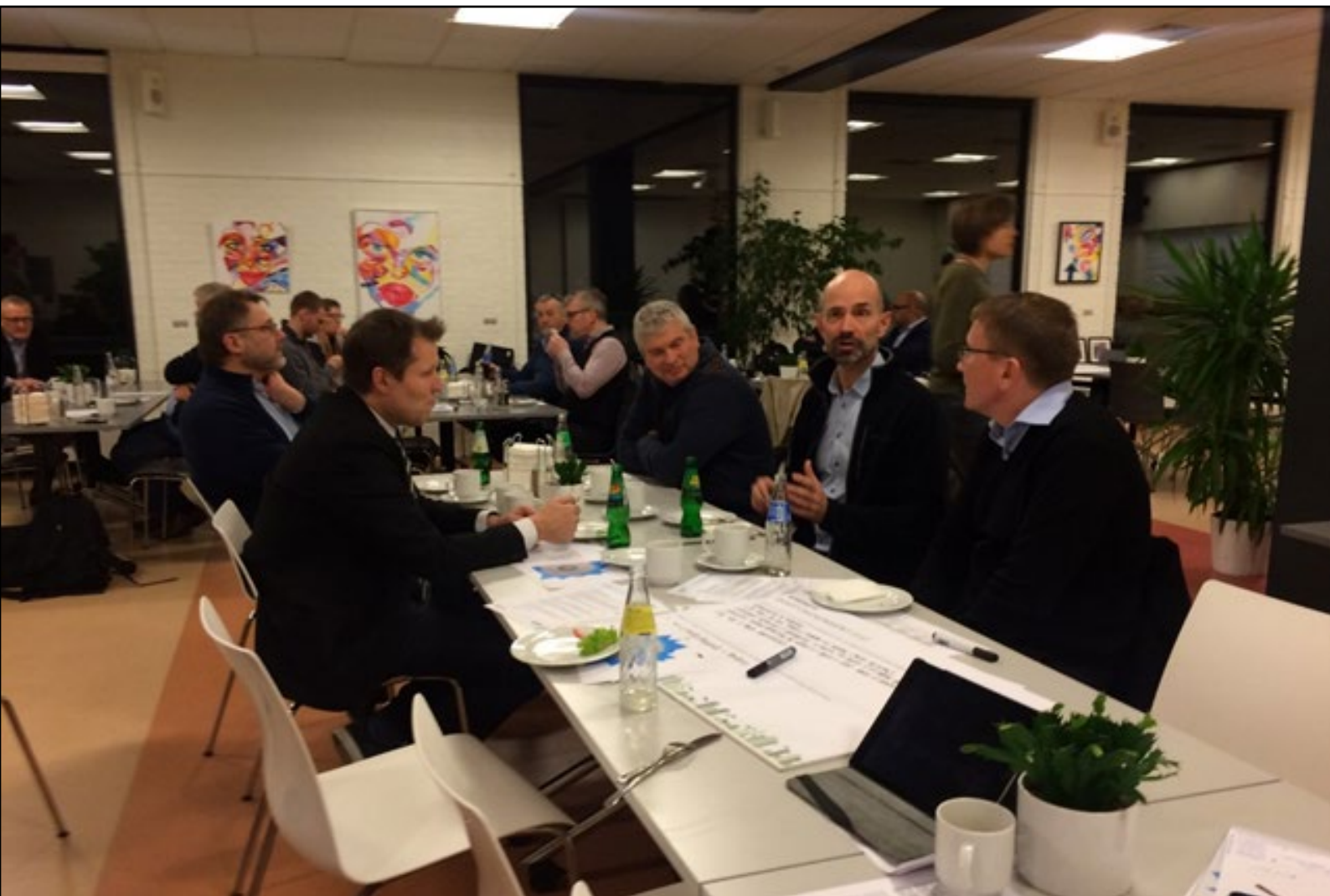
Figur 2: Hvad er smart city i Nyborg Kommune? Det var emnet til opstartsworkshoppen i januar 2017.

Dette er dog kun starten på Nyborgs rejse mod at blive en smart by og et smart samfund. Nu hvor overlæggen er lagt skal en bredere offentlig diskussion være med til at afklare, hvilke konkrete projekter, der kan give værdi i Nyborg Kommune. Se mere om det fremtidige arbejde i kapitlet "Hvad er næste skridt", side 23.