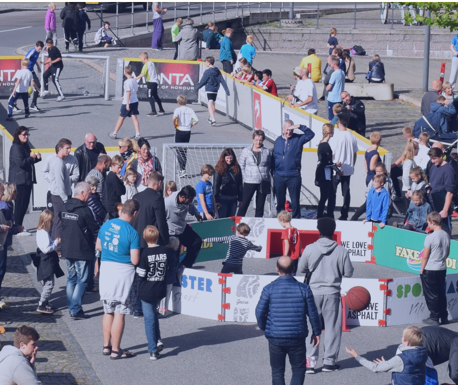
Figur 6: "Gang i Gaden" i Nyborg. Digitale teknologier kan være med til at højne kvaliteten af byrum, levere relevant information til brugerne og skabe en smartere hverdag for kommunens borgere.